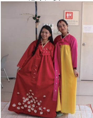
韓国 (チマチョゴリ)