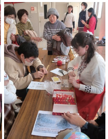
モルドバ (マルツイシヨール)