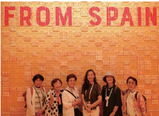
スペイン館館長と

また、アンゴラ館では、旧春日町フレンドシップ大使夫妻が、アンゴラ政府代表（愛知万博の時も政府代表）と20年ぶりに再会し、旧交を温めあいました。