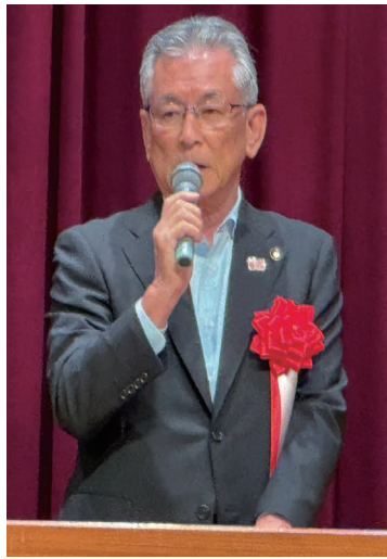
清須市長 永田純夫氏