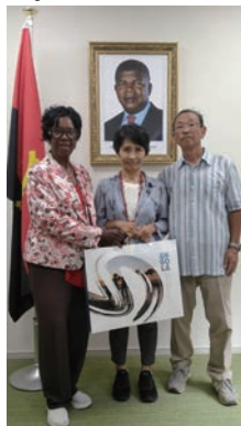
アンゴラ政府代表と