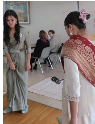
ネパール (チュンギ)