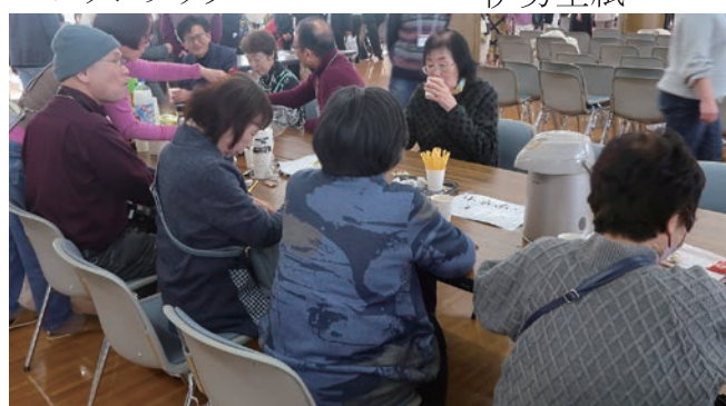
ふれあいコーナー