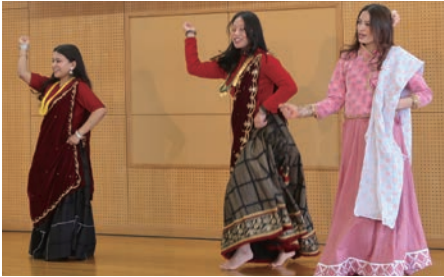
ネパール民族舞踊

バリ島滞在中、現地舞踊団のメンバーとして毎回ステージに出演し、1999年より名古屋にてバリ舞踊教室を開講以来、愛・地球博をはじめ、東京から沖縄等、東海地方を中心に各地で公演を続けてきました。ネパールの女性が和装の花嫁姿に変身したり、お抹茶をいただいたり、ステージ以外でも様々なブースが楽しめました。清須市にも本当に沢山の外国の方がいらっしゃるのを、あらためて知り、会場にいらしていた方達も、みなさま明るく楽しく、こうして交流の機会を持つことが出来、とても嬉しく思います。